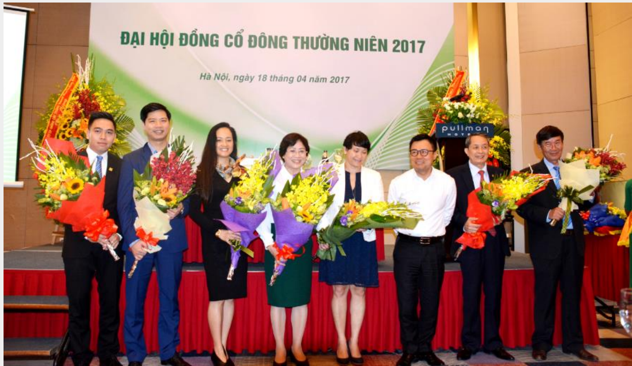
Ảnh: Lễ ra mắt HĐQT nhiệm kỳ 2017 - 2021