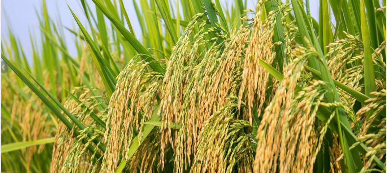
Vinaseed hiện đang dẫn đầu về thị trường lúa thuần tại Việt Nam

Về lúa thuần, Vinaseed hiện đang là Công ty dẫn đầu thị trường, tự tin với bộ sản phẩm đa dạng, năng suất, chất lượng, phổ thích nghi rộng được bà con nông dân ưa chuộng như giống Thiên ưu 8, Khang Dân ĐB, Trân Châu Hương ở phía Bắc và miền Trung, Thơm RVT, Đài Thơm 8 tại ĐBSCL đang phát triển rất tốt, đặc biệt sắp tới Công ty tung ra giống lúa Kim Cương 111 với 3 nhất là “ khả năng kháng bệnh tốt nhất - năng suất cao nhất - phổ thích nghi rộng nhất ”, đây là cơ hội tốt để Vinaseed chiếm lĩnh thị trường.