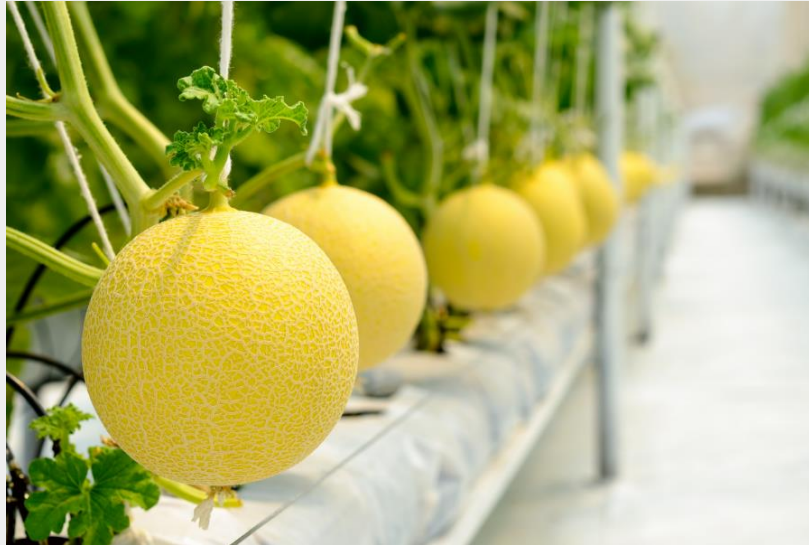
Ảnh: Vinaseed phát triển nông nghiệp CNC với mục tiêu trở thành công ty sản xuất dưa lưới lớn nhất Việt Nam

N gày 18/4 công ty CP Giống cây trồng trung ương tổ chức Đại hội đồng cổ đông thường niên nhiệm kỳ. Đây là dịp để nhà đầu tư đánh giá thành quả lao động năm 2016 và chặng đường 5 năm qua, theo báo cáo của Chủ tịch HĐQT, Tổng giám đốc Trần Kim Liên “năm 2016, Vinaseed như con thuyền lội ngược dòng với những thành tựu ấn tượng trong sản xuất kinh doanh, doanh thu đạt 1.330 tỷ, lợi nhuận cổ đông công ty mẹ đạt 175,2 tỷ, hoàn